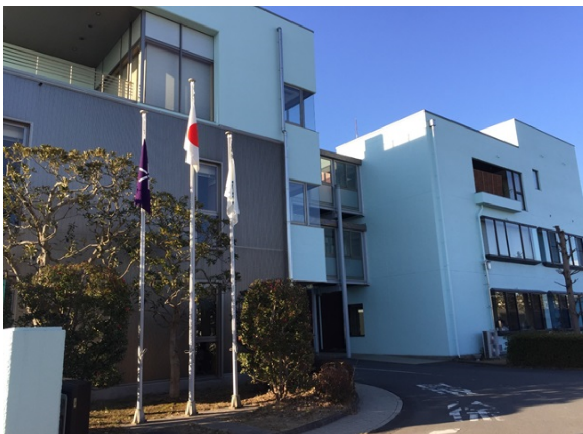
茨城県南水道企業団事務所棟