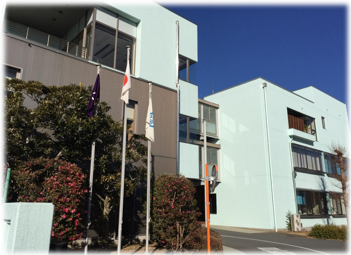
茨城県南水道企業団事務所棟