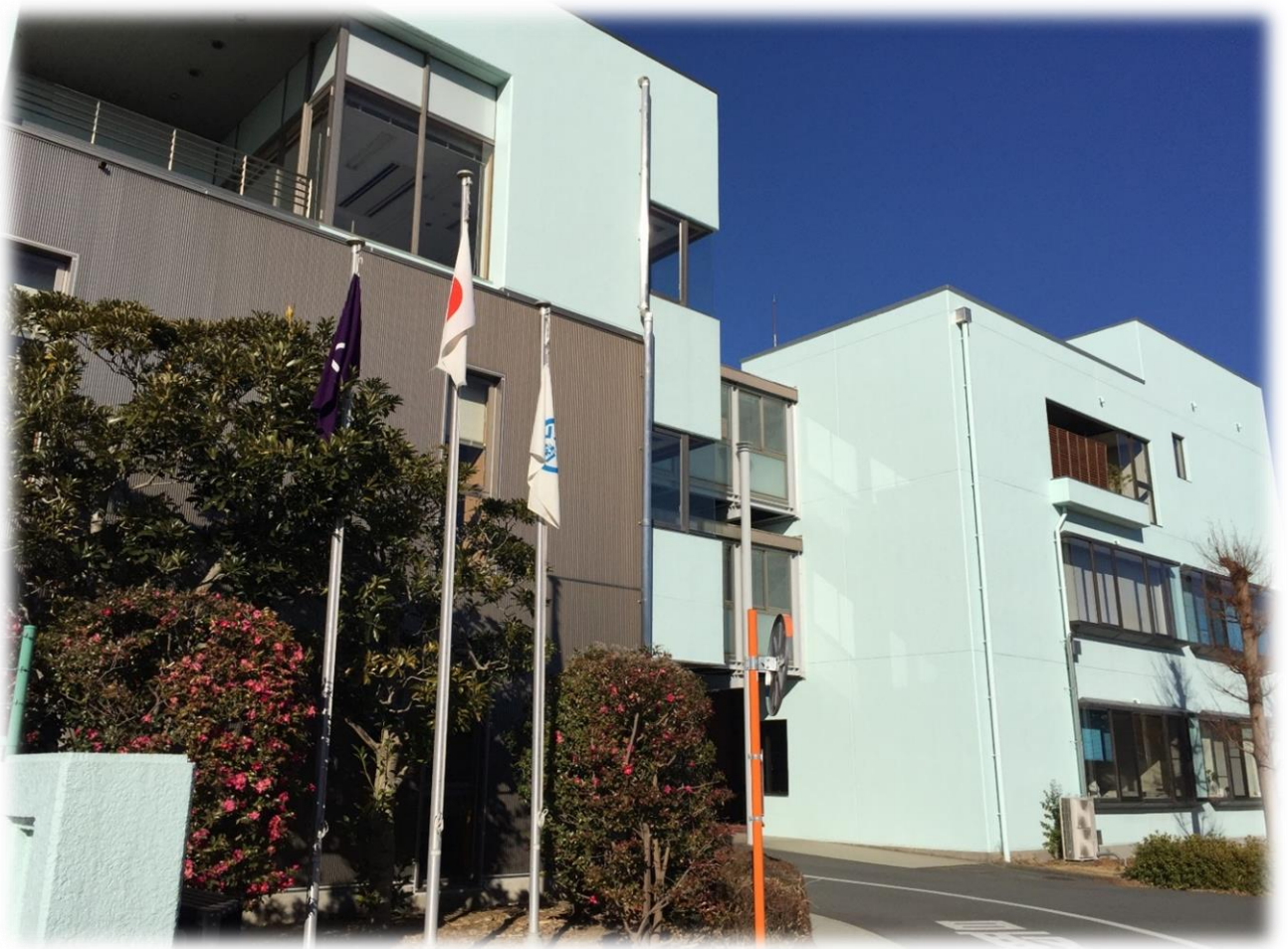
茨城県南水道企業団事務所棟